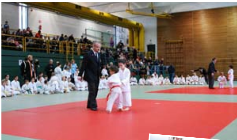
Trofeo di Laives, bambini in gara