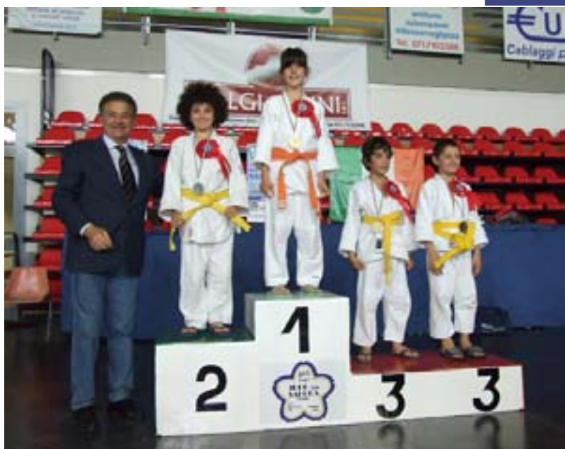
Un podio della categoria Fanciulli

Tuttavia, la società che ha riportato il maggior punteggio nella classifica generale è stata proprio il Judo Club Sakura Osimo, che pertanto si è aggiudicato il Trofeo 2010. A partire da quest'anno, l'organizzazione ha messo in palio anche un altro premio molto più prestigioso: una vera e propria scultura bronzea realizzata da un artista locale, che sarà consegnata alla società vincitrice assoluta del Trofeo per tre volte.