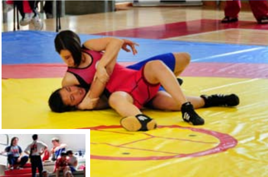
Albonett - Nefzi

In Italia la situazione della Lotta è difficile, soprattutto quando si parla di giovani, perché i tempi che servono a formare un atleta maturo sono lunghi. La sfida consiste proprio in questo, cioè nel puntare alla crescita continua non solo da un punto di vista tecnico-agonistico, ma anche riguardo la sfera psicologica ed emotiva; lo sviluppo deve essere orientato alla persona e non essere centrato solo sul risultato immediato".