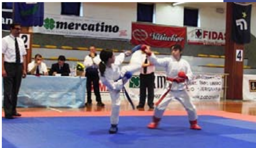
Un'azione di gara