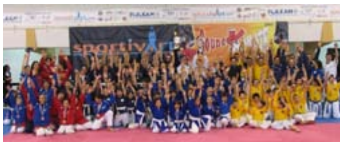
Il saluto dei premiati