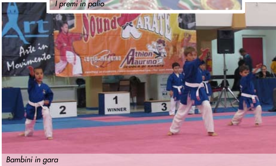
Bambini in gara