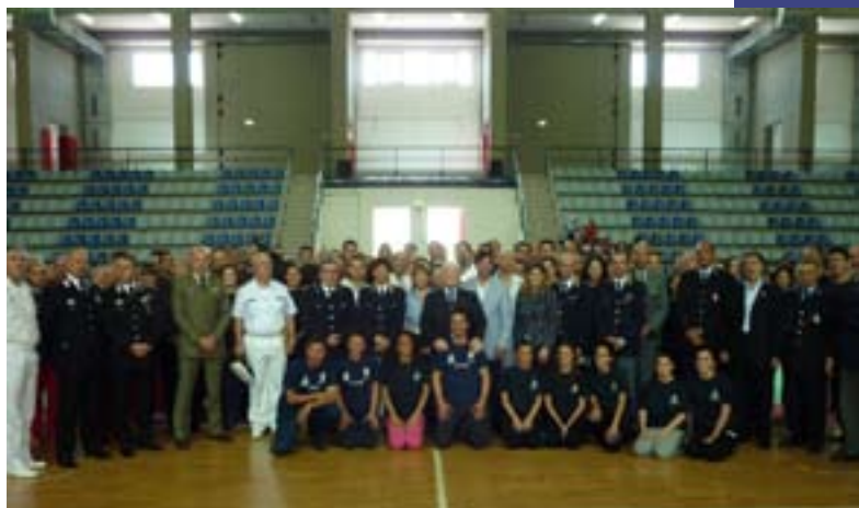
Alcuni momenti dello Stage

Tante le adesioni anche quest'anno (oltre 300 unità) registrate tra i militari e le studentesse universitarie, queste ultime grande novità della quarta edizione del progetto "La Provincia ti difende". Durante lo Stage mattutino i partecipanti del corso hanno messo in pratica le tecniche di autodifesa acquisite in questi mesi.