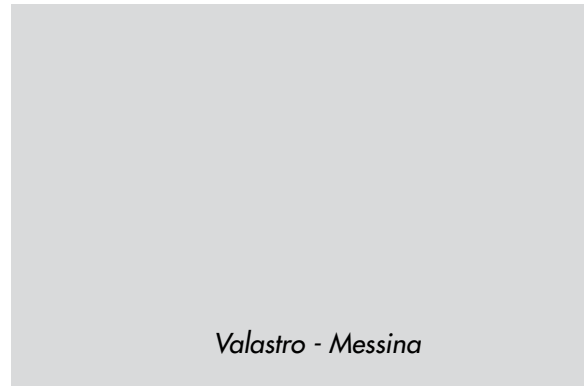
Valastro - Messina