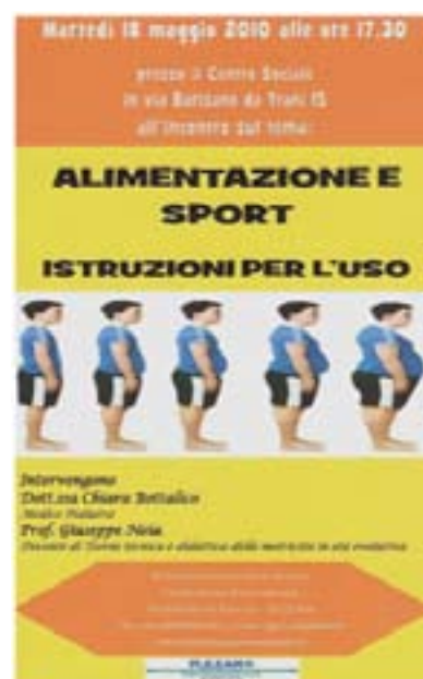
La Locandina della conferenza "Alimentazione e Sport"