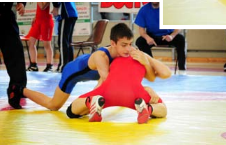
Varrella - Petruk