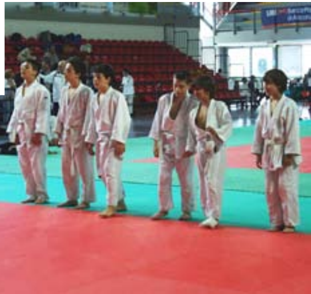
La squadra osimana Esordienti A schierata per il saluto