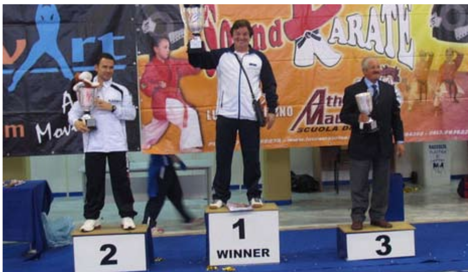
Il podio delle Società: 1 a Goshin Do Barga (Lu), 2 a Picca Kaarte Team (Ba), 3 a Haka Tahir (Sa)