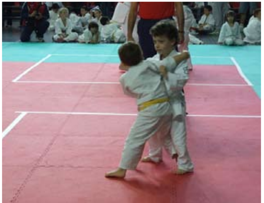
Un'azione di gara della categoria Bambini