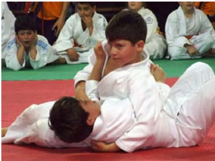
Una fase a terra della gara a squadre Ragazzi