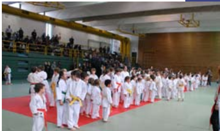
Laives, la presentazione delle squadre preagoniste

A San Lorenzo di Sebato si è quindi conclusa la stagione agonistica invernale 2009-2010 con la grande gara all'aperto con grigliata per atleti, tecnici e simpatizzanti. Erano presenti 13 società comprese alcune provenienti dal Tirolo austriaco con oltre 200 atleti. Il risultato finale ha visto nuovamente il testa a testa tra l'ACRAS e la squadra di casa nuovamente vincente. Al terzo posto il Judo Union Raiffeisen Osttirol dell'Austria.