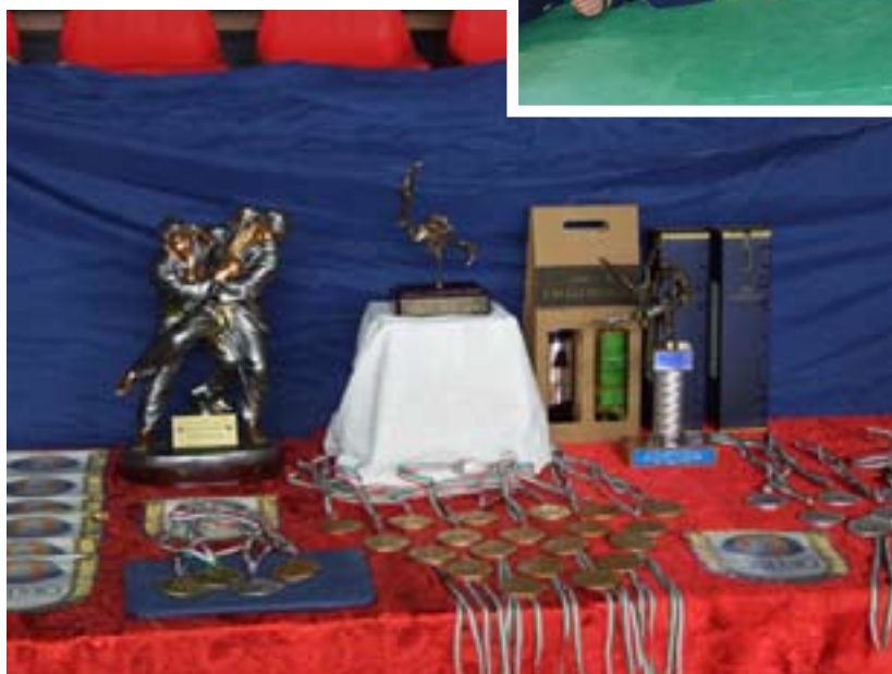
Il tavolo dei premi