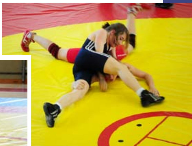
Carieri - Bellon