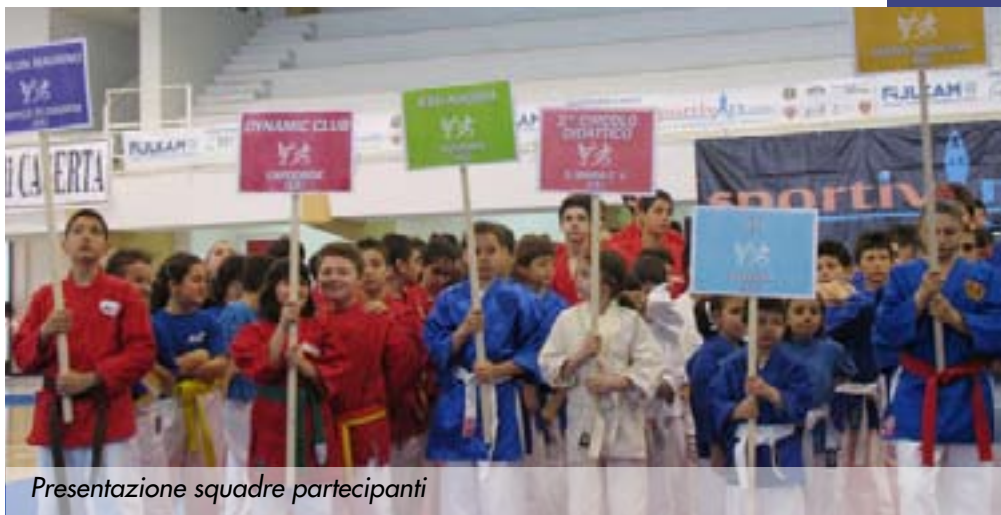
Presentazione squadre partecipanti