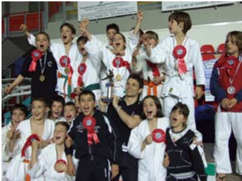
Il C.U.S. Siena sul podio

Si ringraziano altresì tutti gli sponsor che con il loro contributo economico hanno reso possibile questo grande evento sportivo. Ora appuntamento all'anno prossimo!