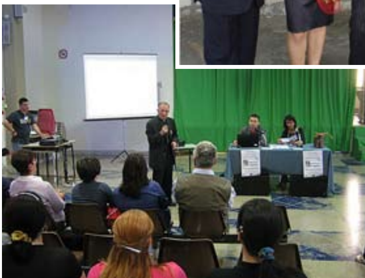
"Internet Usi e Abusi": l'intervento di Mons. Nicola Bonerba