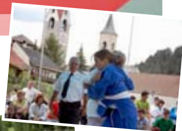
Trofeo FIJKAM di S. Lorenzo di Sebato