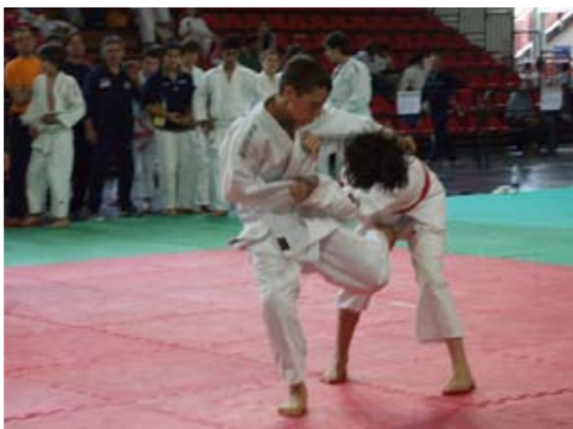
Un'azione di gara