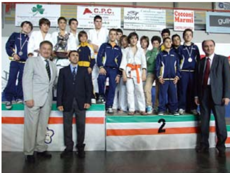
Il Judo Club Sakura Osimo riceve il Trofeo