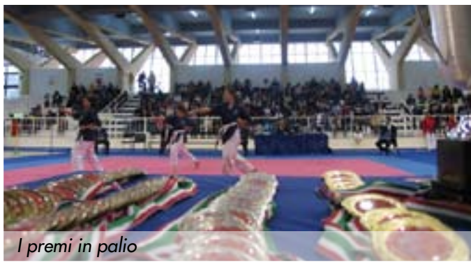
I premi in palio