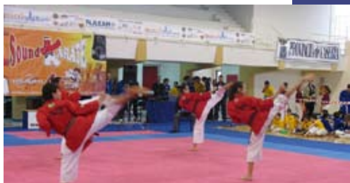
Ragazzi e ragazze in gara