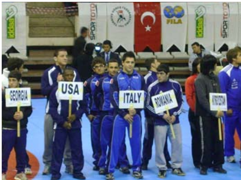
La presentazione delle Squadre