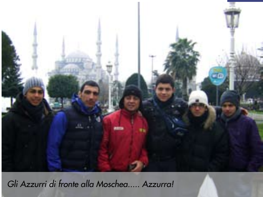
Gli Azzurri di fronte alla Moschea..... Azzurra!