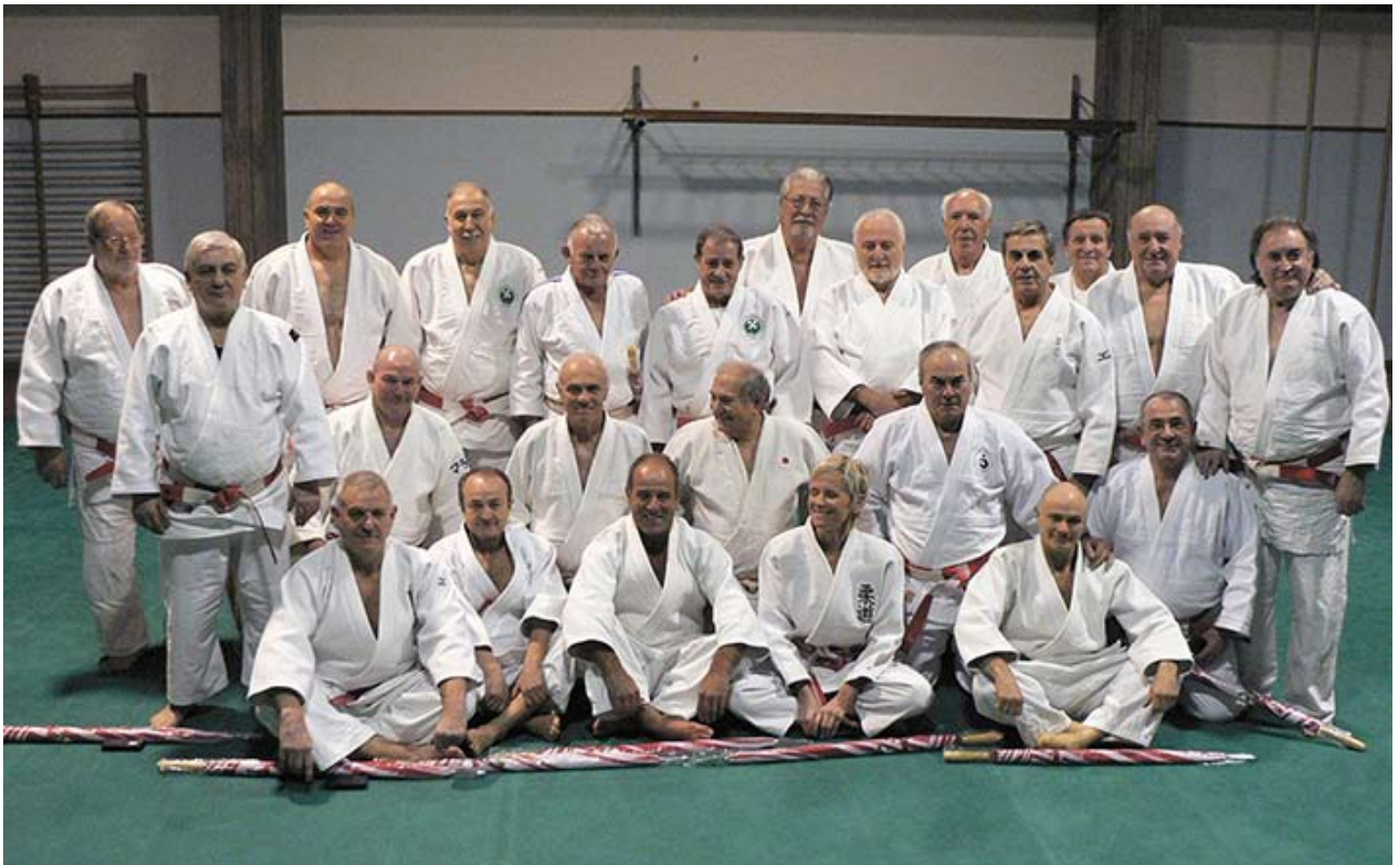
Il gruppo delle Cinture bianca e rossa della Lombardia