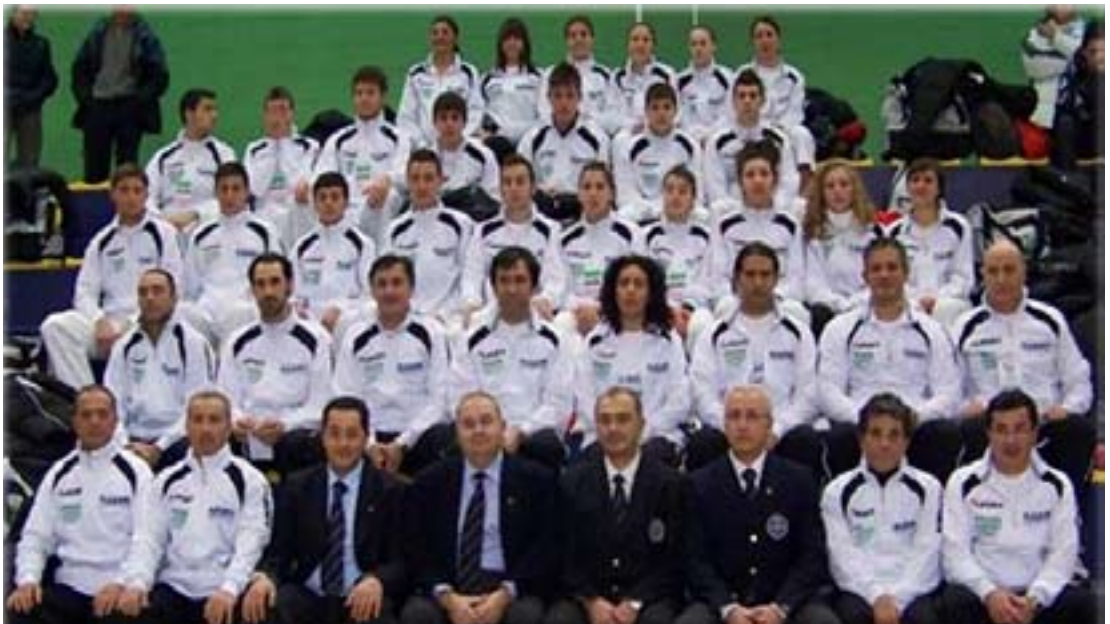
La rappresentativa pugliese al XXIII Campionato Italiano a Rappresentative Regionali