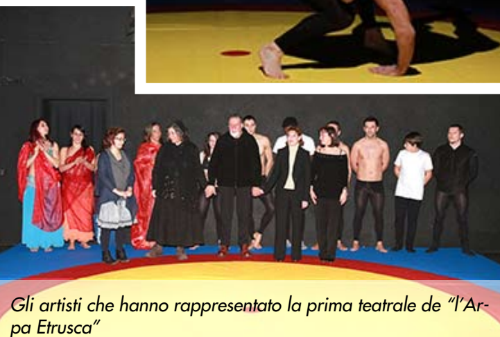
Gli artisti che hanno rappresentato la prima teatrale de "l'Arpa Etrusca"