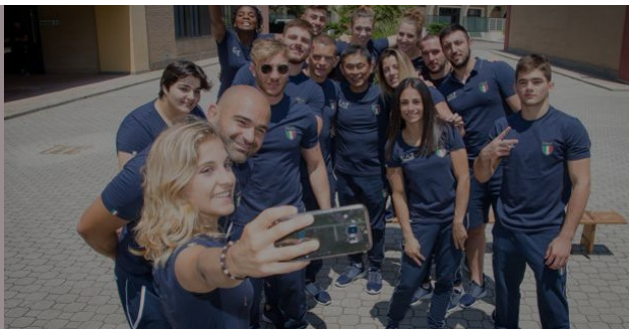
Foto di gruppo per gli azzurri del judo