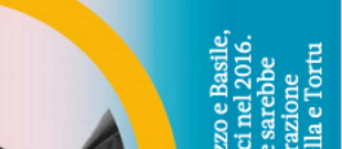
Daniele Garozzo Oro 2016 nel fioretto Garozzo, 27 anni, oro olimpico 2016 e europeo 2017 nel fioretto.

S cherma. «Esercizi e corpo libero Impossibile tirare». Garozzo è pronto per il futuro. «Esercizi e corpo libero Impossibile tirare».