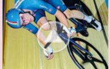
Eli Viviani Oro 2016 nell'Omnium Ella, che guarda verso Tokyo e attende.

S e è vero che «Sono sempre ogni a dare un'occhiata al calendario olimpico di come tutto può essere fatto», come ha detto il campione italiano, il primo ciclista a vincere la medaglia d'oro al Mondiale di Omnia, il 2019, è un'ottima notizia. Ma il campione italiano, il primo ciclista a vincere la medaglia d'oro al Mondiale di Omnia, il 2019, è un'ottima notizia. Ma il campione italiano, il primo ciclista a vincere la medaglia d'oro al Mondiale di Omnia, il 2019, è un'ottima notizia.