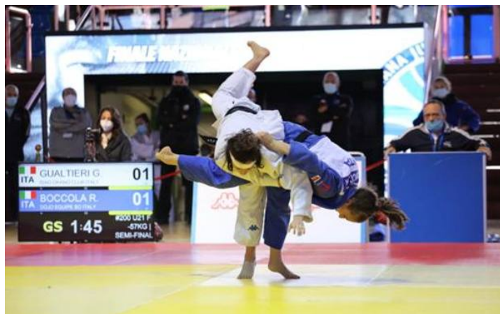
Un momento della gara femminile

Il PalaPellicone ha regalato nuovamente emozioni. Quel momento, atteso così a lungo, è finalmente arrivato con la finale nazionale juniores di judo ospitata sabato e domenica nell'impianto federale a Ostia. Tribune senza pubblico, controlli all'accredito, filtri ai varchi, mascherine a tutti, le precauzioni sono state prese e fatte rispettare puntigliosamente, tant'è che nella prima delle due giornate di gara, quella riservata alle categorie maschili, il risultato di positività riscontrato con gli esami rapidi ha costretto qualche atleta a riprendere immediatamente la strada di casa. In un clima, che da più parti è stato definito surreale, le gare si sono disputate e, come s'è detto, hanno inevitabilmente regalato emozioni forti a quelle ragazze e ragazzi con meno di 21 anni che hanno avuto l'opportunità di poter partecipare.