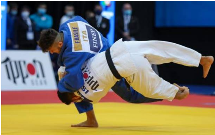
Fabio Basile in azione a Praga

BASILE – Fabio Basile ha faticato con lo scorbutico spagnolo Salvador Cases Roca, ma all'inizio del golden score (13") l'ha steso con una spazzata di piede. Analoga è stata la musica con il greco Georgios Azoidis, incontro con una parità protratta fino ai tempi supplementari, quando (55") è stata infranta da un'altra tecnica di piede, spazzata interna ed Azoidis è andato lungo. Con l'israeliano Tohar Butbul è stata un'altra battaglia, ma un lampo di genialità dell'azzurro ha chiuso il conto senza la necessità di prolunghe varie, wazari di uchi mata con passo incrociato. Basile è stato fermato in semifinale dal georgiano Lasha Shavdatuashvili, oro olimpico nei 66 kg a Londra 2012: su un attacco del torinese, Shavdatuashvili praticamente si è sdraiato e lo ha ribaltato, wazari con immobilizzazione a seguire. La finale per il bronzo purtroppo, è stata vinta dallo svedese Tommy Macias con una magia con il piede che ha rotto l'equilibrio dell'azzurro e lo ha messo schiena a terra.