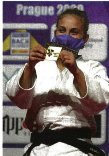
Rivincita Dopo l'argento a Rio 2016, Odette Giuffrida cerca l'oro nel judo a Tokyo

ARTICOLO NON CEDIBILE AD ALTRI AD USO ESCLUSIVO DEL CLIENTE CHE LO RICEVE - 116