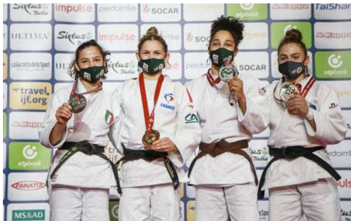
Podio 52 kg femminile

L'Italia ha completato, a Olbia, il campionato del mondo juniores con il settimo posto nella prova conclusiva, la gara a squadre miste. Non è male un settimo posto a squadre a un mondiale, ma la sensazione che potesse andare ancora meglio è nell'aria.