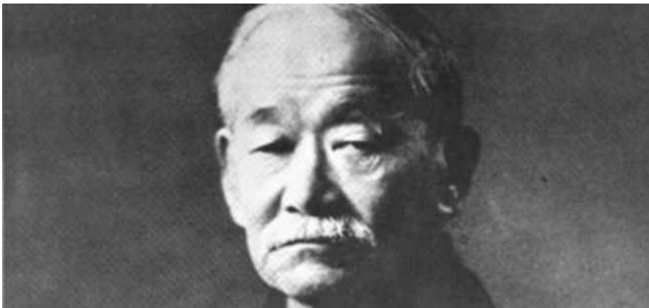
Kanō Jigorō Wikipedia

Kanō Jigorō, chi è? Google dedica il suo Doodle di oggi all'inventore del judo, e noi vogliamo ricordarlo con alcune delle sue massime