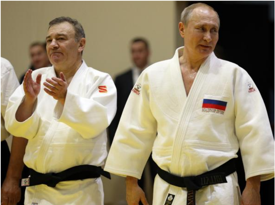
Vladimir Putin (a destra) e Arkady Rotenberg

espulsi dalla Federazione internazionale di judo. La decisione arriva dopo che la stessa Federazione aveva annunciato di aver sospeso il ruolo di presidente onorario di Putin il mese scorso a causa del conflitto in corso in Ucraina : «La Federazione internazionale di judo — si legge nel comunicato emesso il 7 marzo — annuncia che Putin e Rotenberg (ex membro del Comitato esecutivo della Federazione e dal 2013 responsabile dello sviluppo, ndr) sono stati rimossi da tutte le posizioni ricoperte nell'organizzazione».