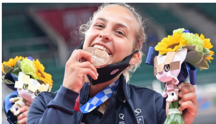
Il bronzo di Tokyo 2020.