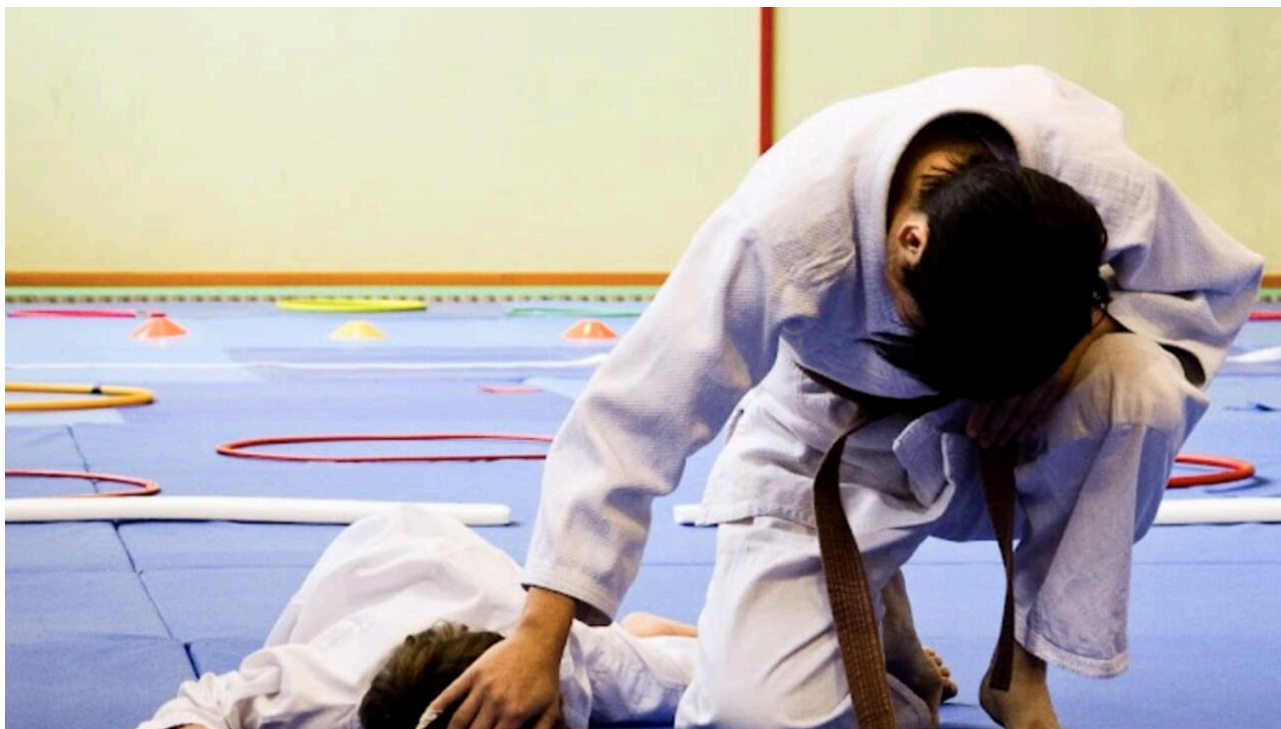
Un judoka in azione