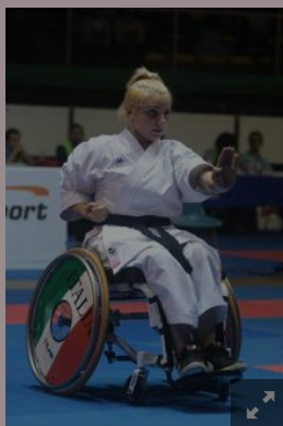
Un'atleta del para-karate

L'importanza dello sport nella vita di tutti i giorni come promotore di benessere e di una migliore qualità di vita, è entrata a gran voce anche nella vita delle persone con disabilità, non solo come una sorta di terapia riabilitativa, ma anche come momento di emancipazione e accrescimento. Le grandi potenzialità psico-motorie delle Arti Marziali, potendo essere praticate da tutti, si prestano in maniera adeguata ad un lavoro specifico con persone che presentano disabilità di diverso tipo e a diverso livello, dando loro la possibilità di conoscere il proprio corpo e ad esprimersi con esso. Ecco che la Federazione Italiana Judo Lotta Karate e Arti Marziali si sta muovendo oggi con passione verso questo mondo attraverso vari progetti anche in visione agonistica: "Il nostro compito - sottolinea il Presidente Domenico Falcone - è quello di fornire ai tecnici interessati gli strumenti giusti per lavorare nel campo e agli atleti la possibilità di migliorarsi e concorrere verso il sogno olimpico". Domenica, al PalaPellicone di Ostia, si svolgerà il 1° Campionato Italiano di Para-Karate di kata dedicato alle categorie carrozzina, non vedenti ed ipovedenti, intellettivo relazionali.