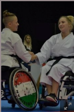
Una recente esibizione tra atlete di para-karate

“Molto perché significa parità a tutto tondo e nessun tipo di discriminazione: anche chi soffre di disabilità vuole mettersi in gioco e noi dobbiamo dare loro questa opportunità. Mi è capitato di conoscere molti atleti e di ascoltare molte storie incredibili agli incontri al CONI durante le Olimpiadi, saranno parole banali ma sono trascinati, hanno una carica ed un entusiasmo unici”.