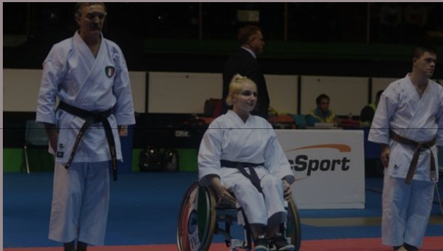
Una recente esibizione di para-karate: domenica 1° Tricolore

“Formare i tecnici attraverso corsi di aggiornamento specifici. Il nostro compito è quello di fornire loro gli strumenti giusti per questo tipo di attività”.