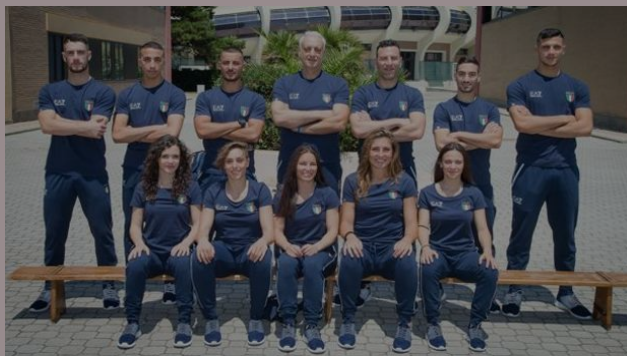
La Nazionale Italiana al Centro Olimpico Federale di Ostia prima della partenza per Terragona