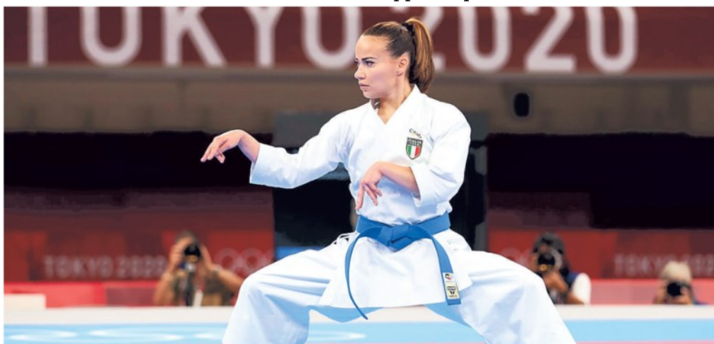
▲ Il trionfo Viviana Bottaro durante la gara di Kata a Tokyo che le è valsa la medaglia di bronzo