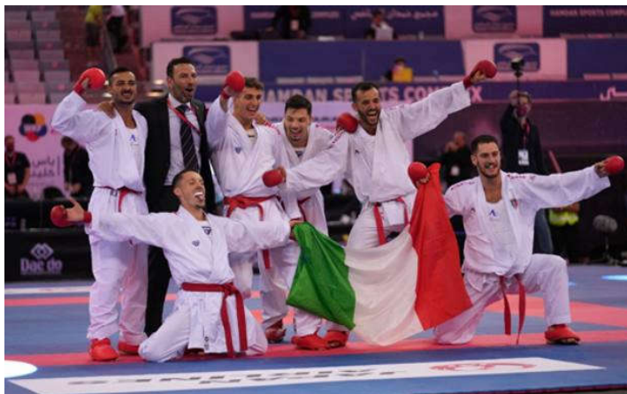
Gli azzurri festeggiano il titolo iridato a squadre