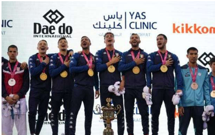
Il podio del kumite a squadre