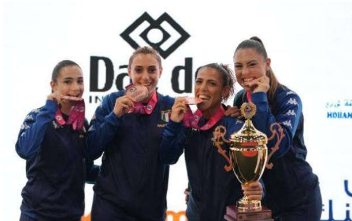
Il team femminile medaglia di bronzo nel kumite

dominato dall'azzurra che, una volta ingranata la marcia, si è trasformata in un cecchino capace di chiudere i conti sul 5-2.