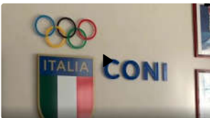
Lo Sport si coalizza contro molestie e violenze: in giunta Coni passa la norma su iniziativa della Fise