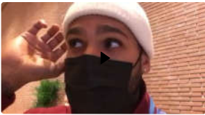
Jacobs: «Un altro bel premio, ora testa alla prossima stagione»