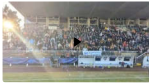
Il Bergerac (Serie D francese) batte il Metz e vola ai trentaduesimi della Coppa di Francia