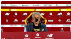
Mourinho: "Lasciate tranquillo Zaniolo, i gol non contano"