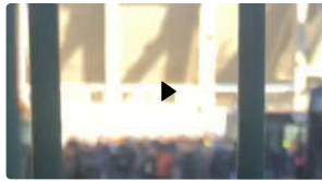
L'arrivo del pullman dei tifosi della Roma allo stadio dell'Atalanta