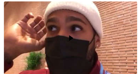
Jacobs: «Un altro bel premio, ora testa alla prossima stagione»