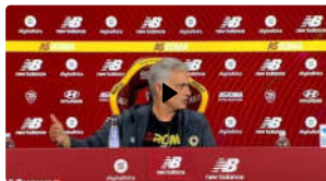
Mourinho: "Per i progetti a lungo termine ci vuole empatia"