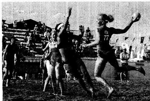
Una gara di beach handball a Platamona