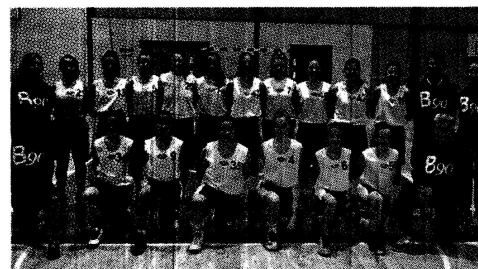
La squadra under 14 del Basket 90