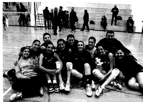
Foto di gruppo per le ragazze dell'Alephmatic Castelsardo