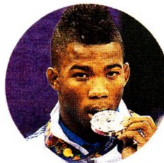
Frank Chamizo, oro iridato

UNA SQUALIFICA DI 2 ANNI GLI NEGÒ LONDRA 2012 ERA UN ETTO SOVRAPPESO