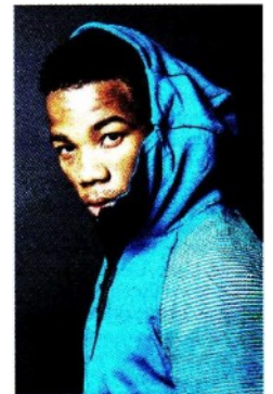
Frank Chamizo, 26 anni, è stato oro mondiale a Las Vegas 2015 nei 65 kg e Parigi 2017 nei 70 kg