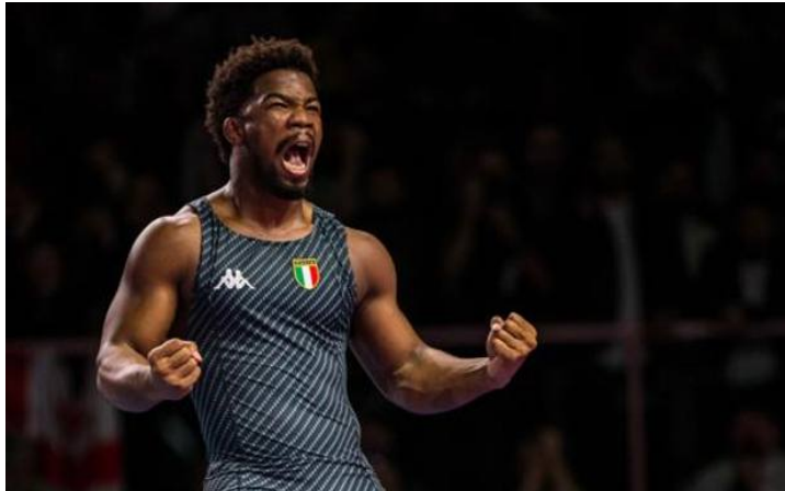
Frank Chamizo, 27 anni