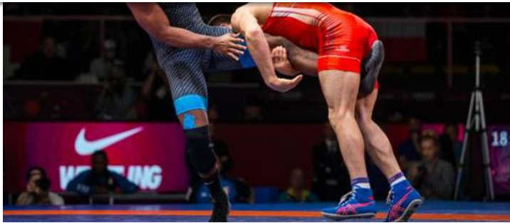
Un momento della finale tra Frank Chamizo e Magomedrasul Gazimagomedov